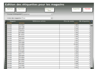
Liste Edition des étiquettes