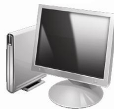
Gestion de magasin