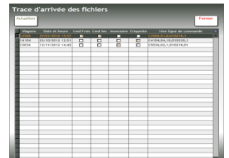
Trace Arrivées de commandes