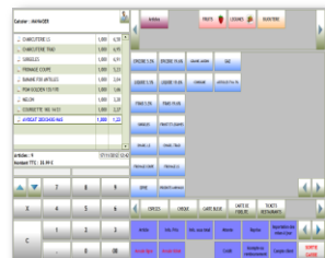
Ecran de Ventes