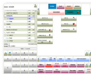
Ecran de Ventes