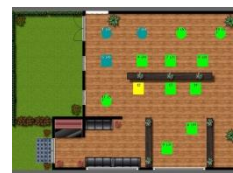
Plan de salle