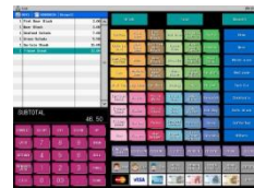
Ecran de vente